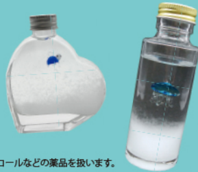
※アルコールなどの薬品を扱います。

体験料 1,100～2,700円 開催時間 11:00～、14:00～ 所要時間 40分間 できる物 1つ 定員 各回18組