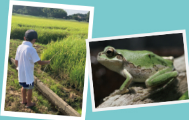
※天候により巨大ザメの操作に変更する場合があります。

体験料 400円 開催時間 11:00～、14:00～ 所要時間 90分間 できる物 つり道具一式 定員 各回8組