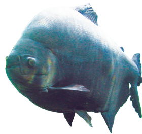
③ブラックコロソマ