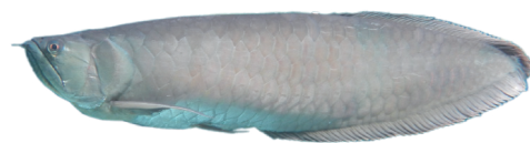
②シルバーアロワナ