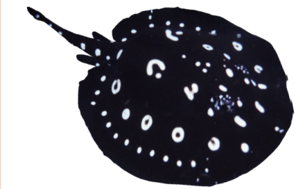
④ポルカドット・ステイングレイ