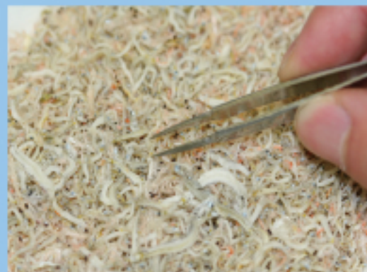
チリモンウォッチ