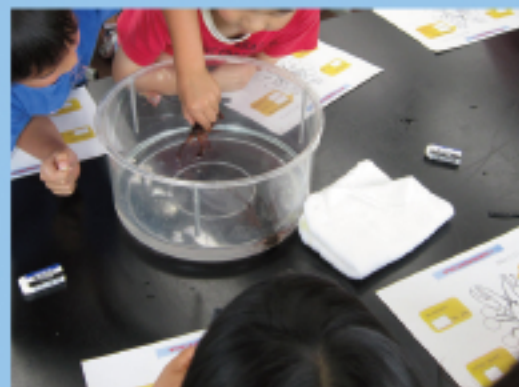
ザリガニとともだちになろう