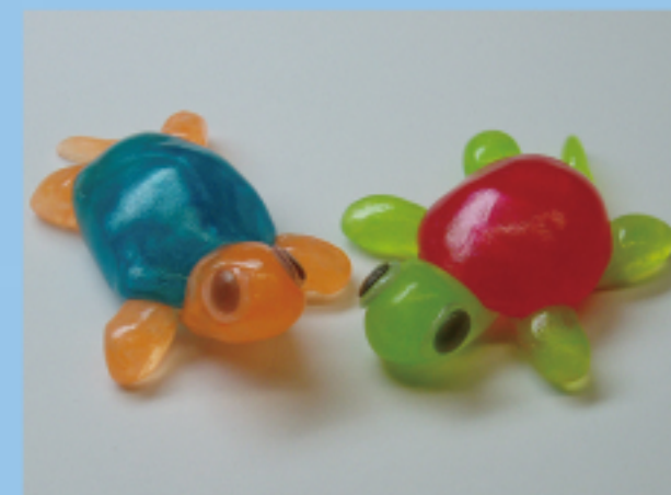
おゆまるでさかな作り